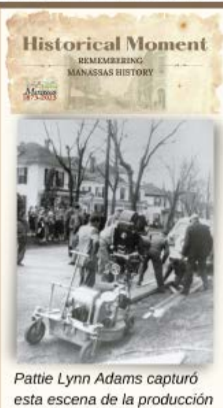
con su cámara Brownie.

En nuestra celebración del 1 de abril, Ud. tendrá la oportunidad de ver qué artículos se ponen en la cápsula del tiempo y participar en muchas otras actividades que se llevarán a cabo en el evento. El evento se llevará a cabo en el parque Dean y habrá transporte disponible en el estacionamiento triangular frente al garaje público para que pueda estacionarse en el centro y llegar cómodamente al evento. ¡El espectáculo de fuegos artificiales de esa noche será fantástico y espero verlo allí!